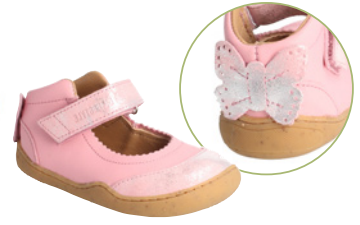
bLIFESTYLE Maniola ab € 75,- Glattleder, versch. Farben