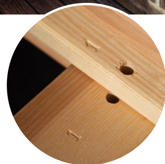
Nummerierung für einfachen Auf- & Abbau