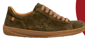
El Naturalista Amazonas € 129,90 Veloursleder, grün