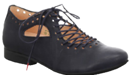
Think Guad € 169,90 Glattleder, blau