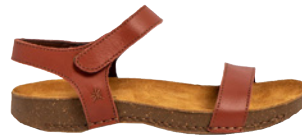
Art, I breathe € 79,90 Glattleder, braun // schwarz