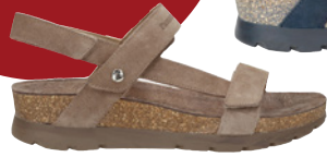
Panama Jack Selma € 119,- Nubukleder, braun // blau