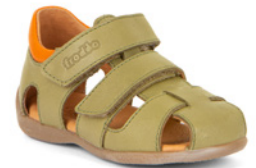
Froddo Carte double ab € 65,- Glattleder, grün