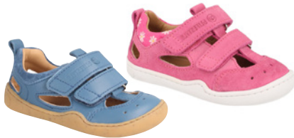
bLIFESTYLE Salamandra ab € 75,- versch. Leder, versch. Farben