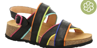
Think Koak € 149,90 Leder-Kombi, schwarz-kombi