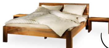
Bett Pur € 1.970,-*