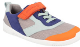
bLIFESTYLE Dodo ab € 80,- Textil, versch. Farben