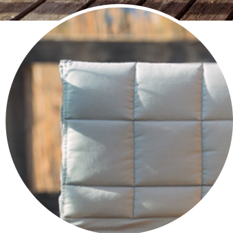
Jetzt neu: Polsterhaupt in vielen Farben