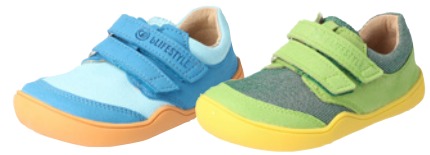
bLIFESTYLE Crocodile ab € 70,- Glattleder, versch. Farben