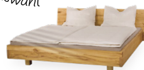
Bett Wing € 2.190,-*