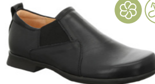
Think Pensa € 199,90 Glattleder, schwarz

Think! Gesunde Schuhe • Bewusst • Schön.