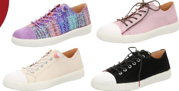
Think Turna ab € 159,90 versch. Leder, verschiedene Farben