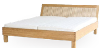
Bett Aurora € 1.990,-*