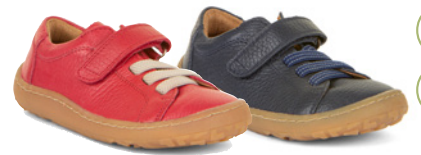
Froddo Barefoot ab € 67,- Glattleder, rot // schwarz