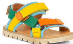
Froddo Flash ab € 67,- Multimaterial, versch. Farben