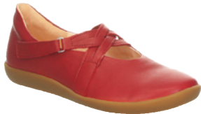
Think nature € 159,90 Glattleder, rot