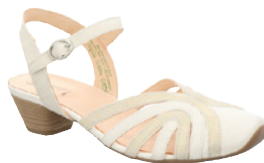
Think Aida € 189,90 Glattleder, weiß-kombi