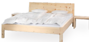
Bett Zirbe € 2.825,-*