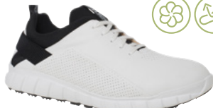
Ganter Milk € 209,- Glattleder, weiß