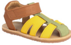
bLIFESTYLE Belliana ab € 75,- Glattleder, versch. Farben