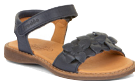
Froddo Lore Flowers ab € 62,- Glattleder, blau // braun