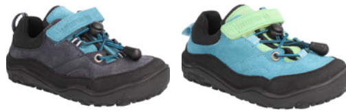
bLIFESTYLE Caprini ab € 90,- Verloursleder, versch. Farben