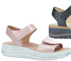
Hartjes Woogie Sandale € 139,- Glattleder, versch. Farben