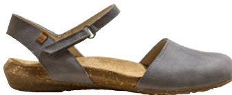
El Naturalista Wakataua € 109,90 geöltes Nubukleder, blau