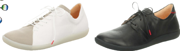
Think nature € 169,90 Glattleder, schwarz // weiß-kombi