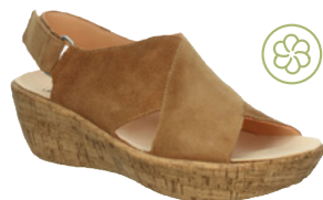
Think Kate ab € 139,90 Nubukleder + Kork, braun