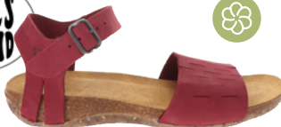
Loints of Holland Veldstreek € 149,90 Nubukleder, rot