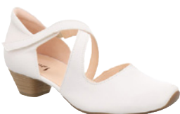
Think Aida € 189,90 Glattleder, weiß