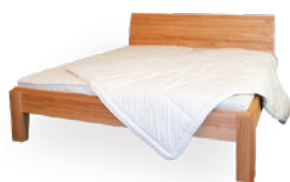
Bett Waldos € 1.990,-*

*Basispreis bezieht sich auf 180 x 200 cm in Buche oder Erle