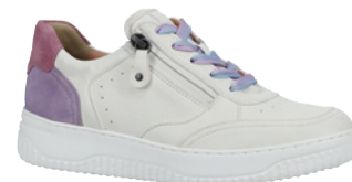
Hartjes Woogie € 179,- Leder-Kombi, versch. Farben