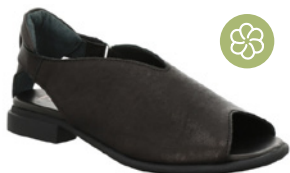
Think Kamaa € 139,90 Glattleder, schwarz