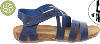
Loints of Holland Veldstreek € 149,90 Nubukleder, blau