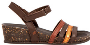
Art, I imagine € 79,90 Glattleder, braun-kombi