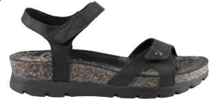
Panama Jack Sulia € 119,- Veloursleder, schwarz