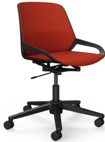
Numo Task mit Säule € 604,- ohne Rückenpolster € 654,- mit Rückenpolster (wie abgebildet)