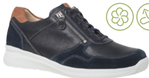
Ganter Harald € 209,- Leder-Kombi, dunkelblau