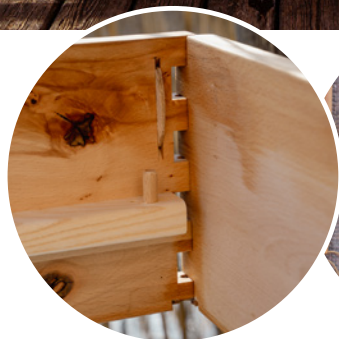
100 % metallfrei: Holz- Steckverbindungen und -zubehör