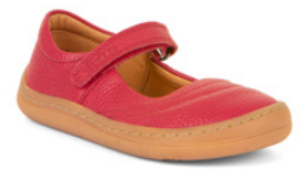
Froddo Barefoot ab € 66,- Glattleder, rot