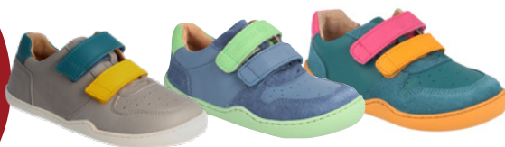
bLIFESTYLE Anura ab € 75,- Glattleder, versch. Farben