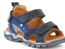
Froddo Karlo ab € 70,- Glattleder, blau