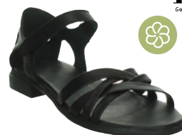
Think Kamaa € 149,90 Glattleder, schwarz