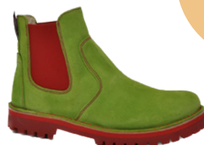
Grünbein Anke € 139,90 Nubukleder, grün