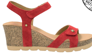
Panama Jack Julia € 119,- Veloursleder, rot