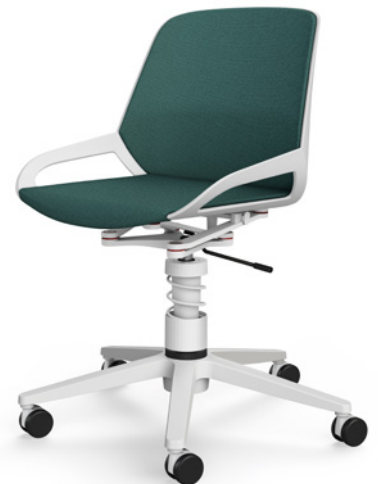
Numo Task mit Feder € 745,- ohne Rückenpolster € 796,- mit Rückenpolster (wie abgebildet)