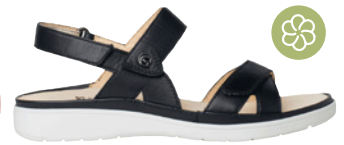
Ganter Evi € 159,- Glattleder, dunkelblau

Viele weitere Modelle bei Vega Nova – 6 x in Österreich