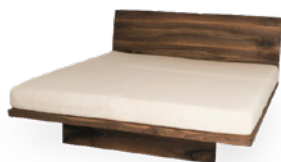
Bett Air € 2.190,-*