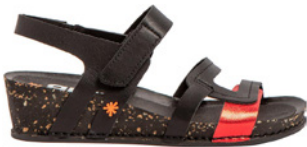
Art, I imagine € 89,90 Glattleder, schwarz-kombi