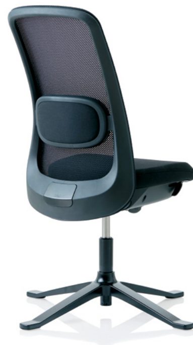
Design: Frost Produkt AS, Powerdesign AS und Flokk Designteam. Patent- und Designgeschützt.